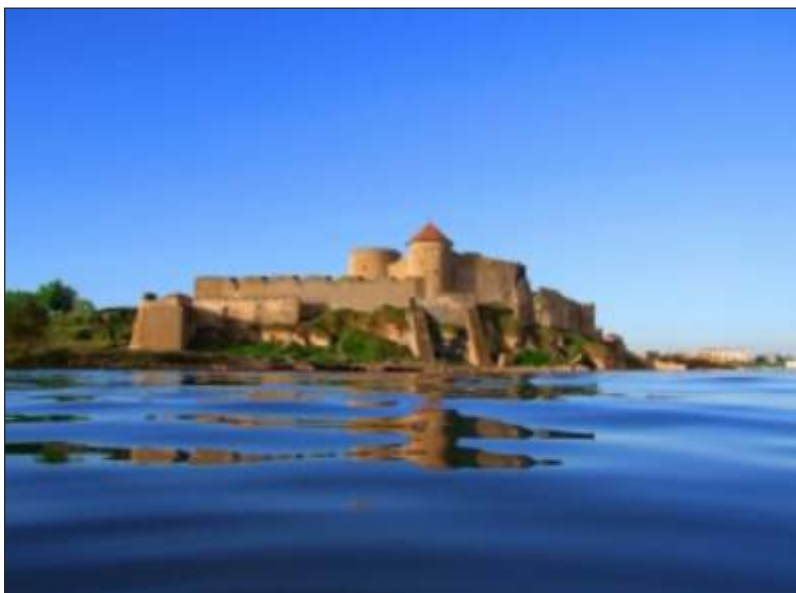
Twierdza Akerman nad Morzem Czarnym, Ukraina