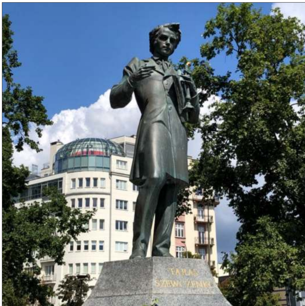
Pomnik Tarasa Szewczenki w Warszawie. Projekt Anatolija Kuszczu, 2002