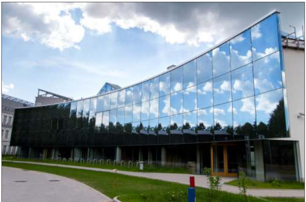
Nowy kampus Uniwersytetu w Białymstoku, ul. Ciołkowskiego 1