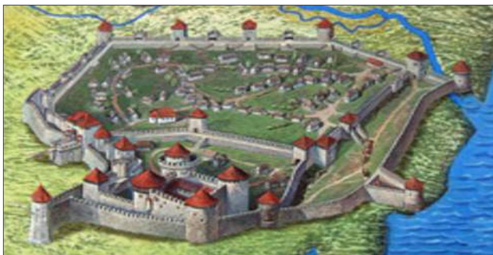
Twierdza Akerman nad Morzem Czarnym. Miejsce pobytu Adama Mickiewicza, autora Stepów Akermańskich